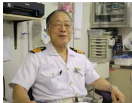
いざというときの安心は日本人医師

食事の選択肢も豊富です(一部有料)。豪華なフルコースディナーも毎日続くとちよつと辛い場合も。「あつさり和食」に癒えてくれるのが、日本船ですね。