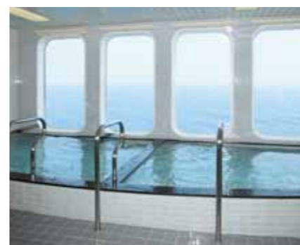
日本船なら大浴場でゆったり

「初めてのクルーズ旅行」の場合、期待とともに不安も大きく、「どのクルーズにしようか」と思案する人もいるでしょう。日本船、外国発着の外国船、日本発着の外国船、と大きく3つに分類でき